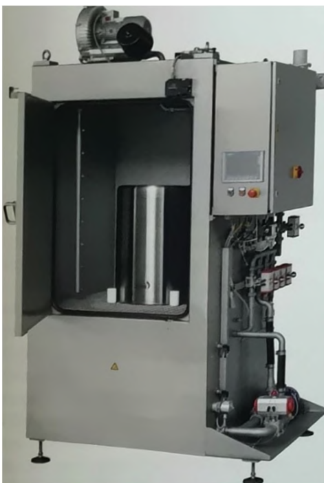
Afb. 2 Gesloten wasinstallatie Simoflex Eco V2

Het reinigen van drums of containers met een hogedrukreiniger is lawaai-erig, vervuilend en geeft een verhoogd risico op letsel. Een wasinstallatie heeft die nadelen niet, gaat zuiniger om met water en wasmiddelen en levert een betrouwbaarder resultaat. Het reinigingsproces kan worden geïntegreerd in een kwaliteitsmanagementsysteem.