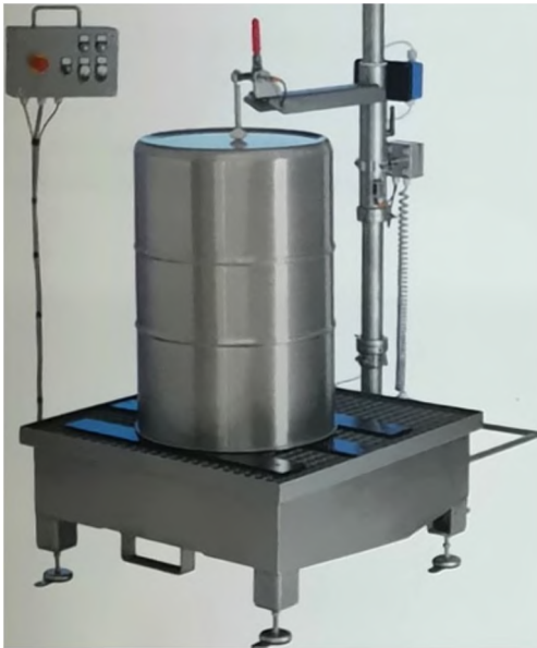
Afb. 1 Mobiele wasinstallatie Simoflex A

Vaak worden vervuilde drums gereinigd met een hogedrukreiniger. Een betere oplossing is het gebruik van wasinstallaties van Simoflex. Deze systemen reinigen de drums betrouwbaar en ecologisch verantwoord en ontlasten medewerkers.